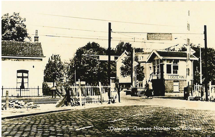
Oisterwijk, Overweg Nicolaas van Heststraat

Achter de hoven der huizen ten noorden van de Linde en ten westen van de Karkhovensestraat (aldaar tegenwoordig Johannes Lenartzsstraat geheten) strekte zich De Dorenakker uit, een groot stuk land. Oorspronkelijk lijkt die eigendom te zijn geweest van de Luppechts. Als gevolg van het erfrecht ten aanzien van vrij-eigen goed is de Dorenakker evenwel in het begin van de 15 e eeuw al versnipperd. We spreken nu over de zuidoostelijke hoek van de Dorenakker. Die lag ten noorden van een pad dat tegenwoordig aan de westelijke zijde van de Johannes Lenartzsstraat ternauwernood meer is te ontwaren, namelijk tussen een rij ver op het stoeppad uitspringende huisjes en een nieuwer pand, waarin kapsalon Vugs was gevestigd.