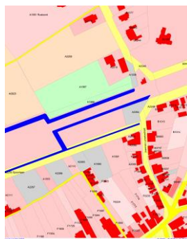
1950 kadaster A.1951, F.2064, 2264