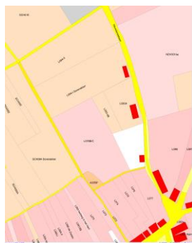
1400 reconstructie L83