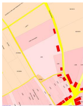
1700 reconstructie L83