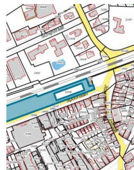
2023 kadaster F.2947-2948, 3089, 3152, 3253