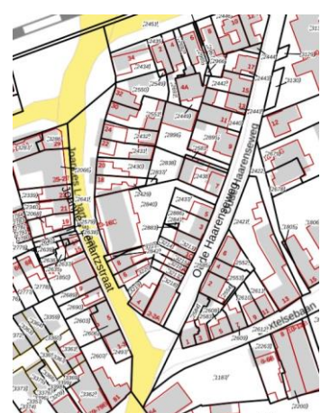
2023 kadaster B. 2429-2432, 2437-2438, 2440-2444, 2449, 2549-2551, 2581, 2837-2839, 2840-2842, 2883, 2886, 2895-2896, 2966, 3213-3221