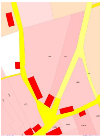
1400 reconstructie L86-87