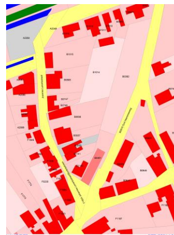
1950 kadaster B.382, 481, 747-748, 936-938, 1014-1015, 1141-1142