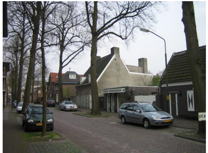
Hoogstraat in 2009