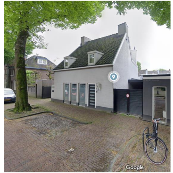
Hoogstraat in 2023