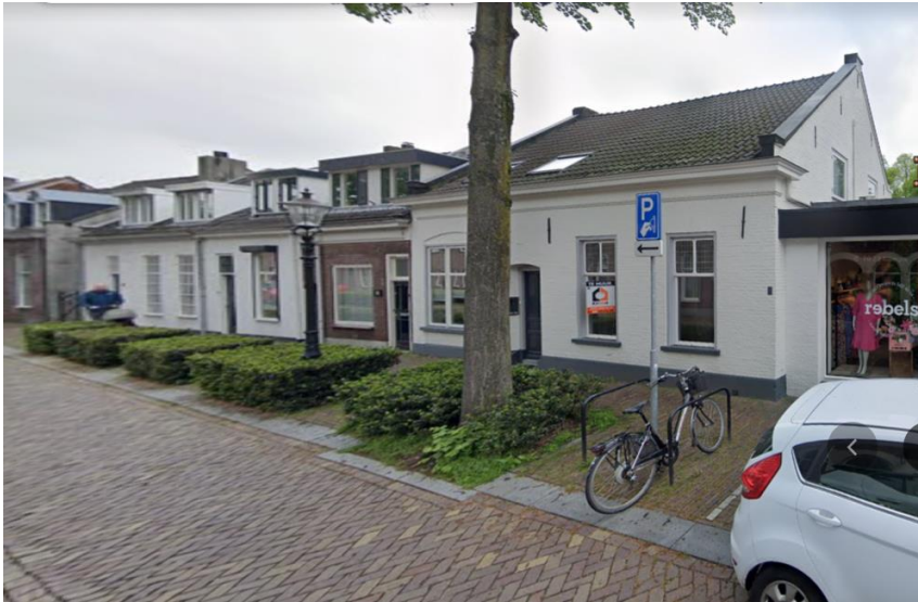
Kerkstraat in 2023