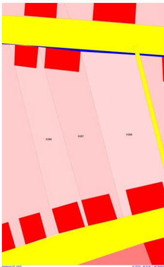
1400 reconstructie K87