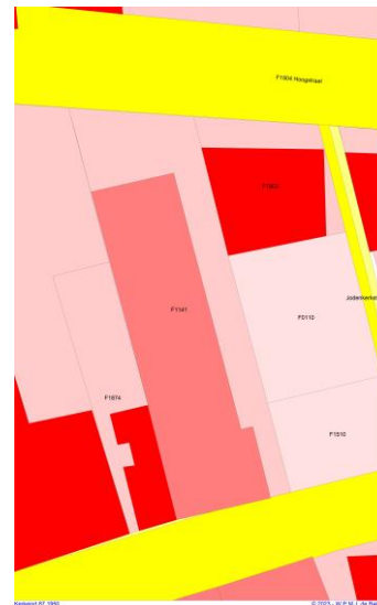
1950 kadaster F.1141