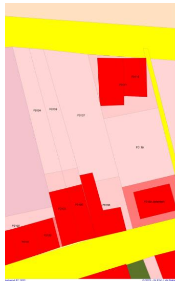
1832 kadaster F.107-108