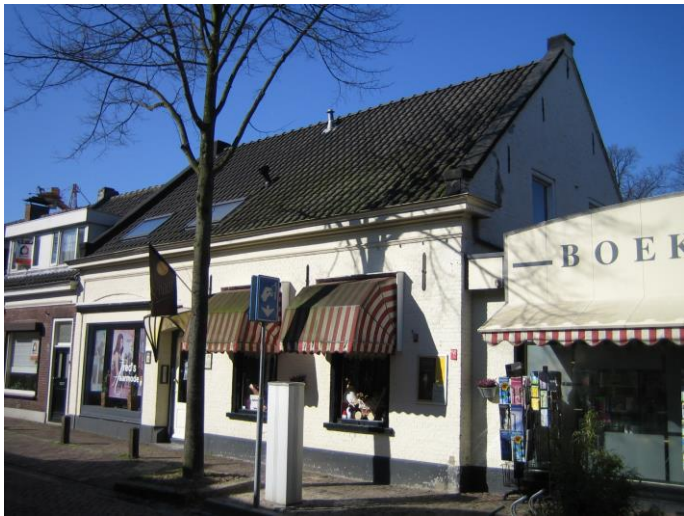
Kerkstraat in 2009