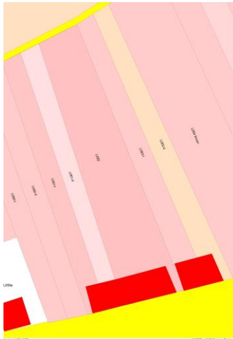
1400 reconstructie L62

Na de dood van Johannes Nicklaas in 1825 72 zijn dit huis en de huisjes daarnaast, waarvan de eigendom tot dan slechts bloot was geweest, in één hand terechtgekomen, zodat de gelegenheid zich heeft voorgedaan om dat groot gebouw te zetten wat er nog staat.