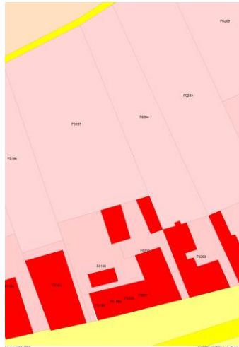
1832 kadaster F.197 deels en 202