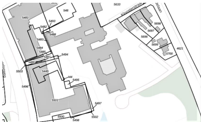
2023 kadaster E5481 Poirterstraat 3 5061 BG van Kemenadelaan 24